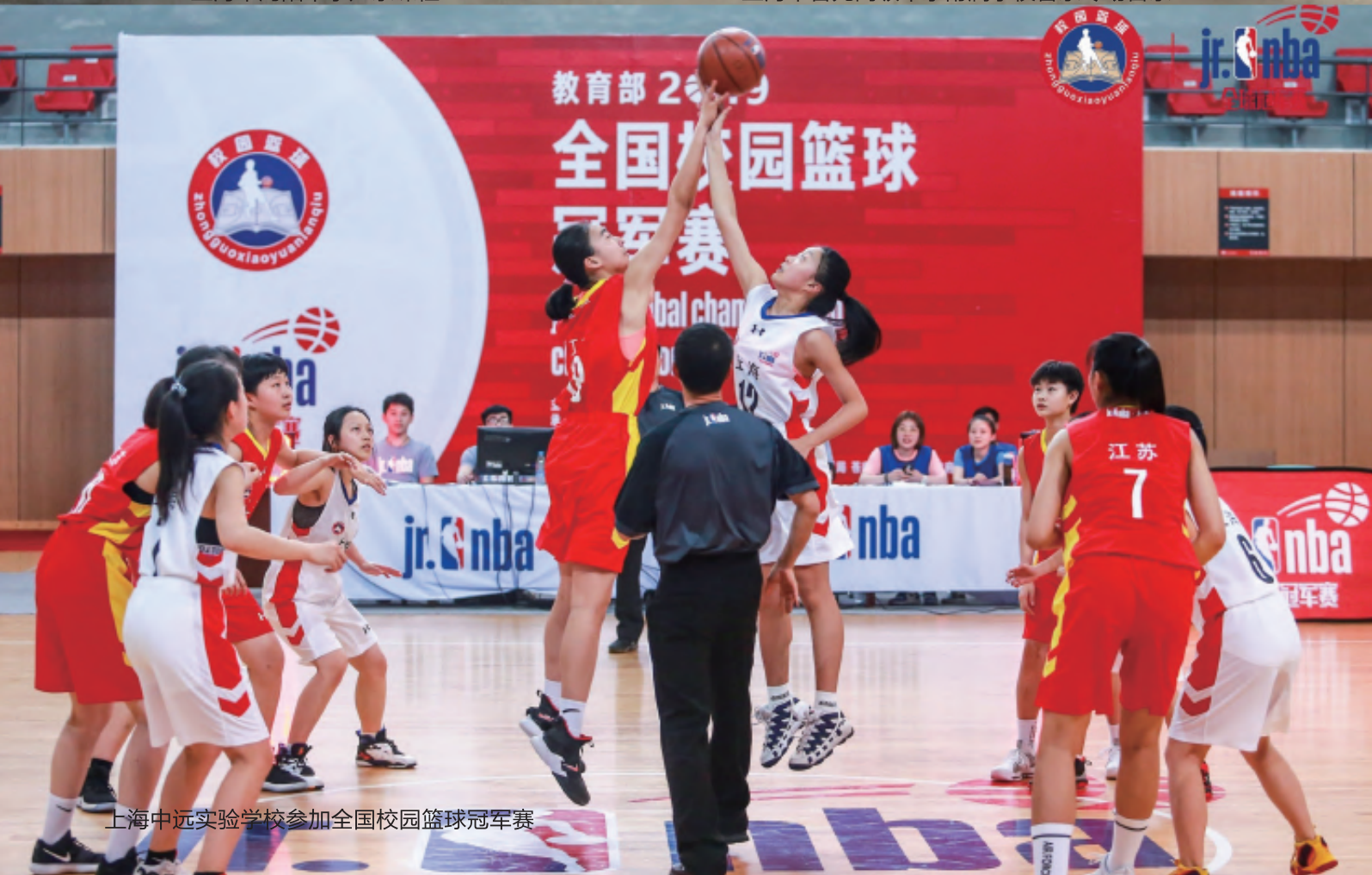
上海中远实验学校参加全国校园篮球冠军赛