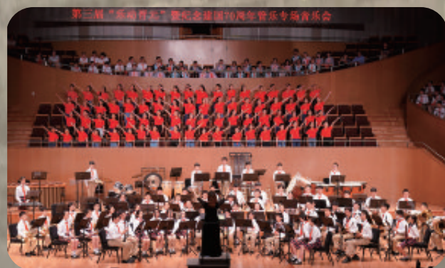
上海市晋元高级中学附属学校管乐专场音乐