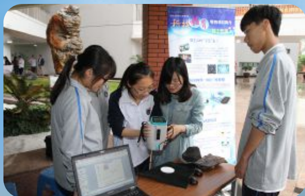
同济大学第二附属中学学生科技活动