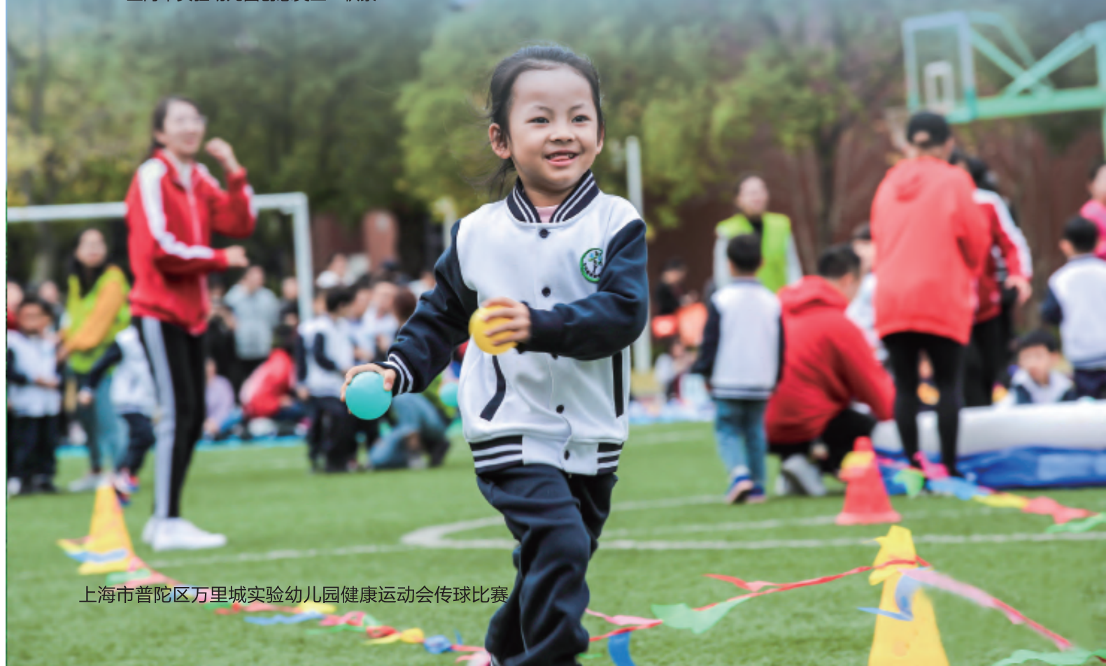
上海市普陀区万里城实验幼儿园健康运动会传球比赛