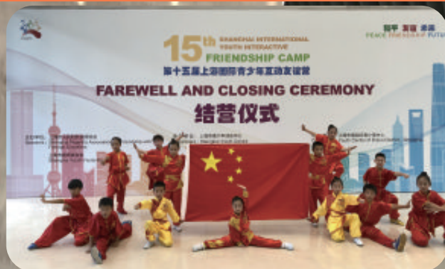
上海外国语大学尚阳外国语学校武术项目展示