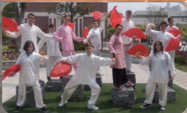
上海市曹杨第二中学老师带领德国姊妹校学生练扇子舞