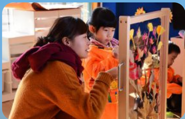
上海市实验幼儿园创意美工“秋景”