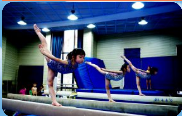
上海市普陀区朝春中心小学体操课程