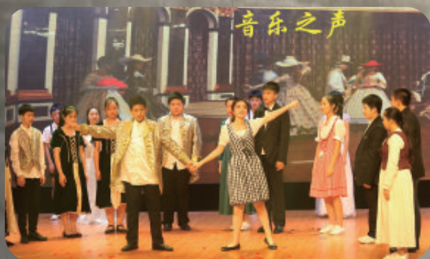
上海市洵阳中学声乐课程