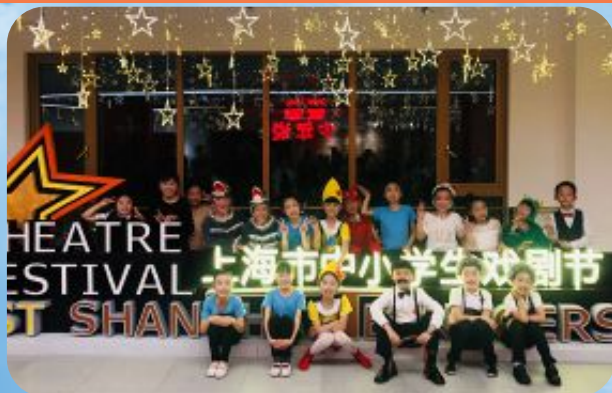
上海市普陀区洵阳路小学戏剧《木偶再遇记》