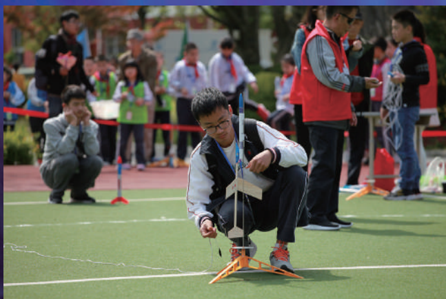
上海市闵行第三中学承办的闵行区科技节展示火箭发射