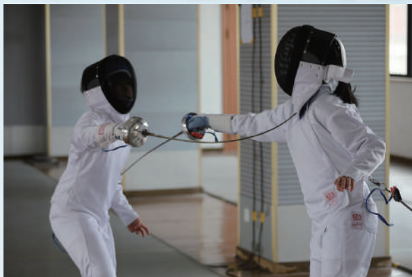
上海市闵行区莘庄镇小学体育节击剑班班赛活动