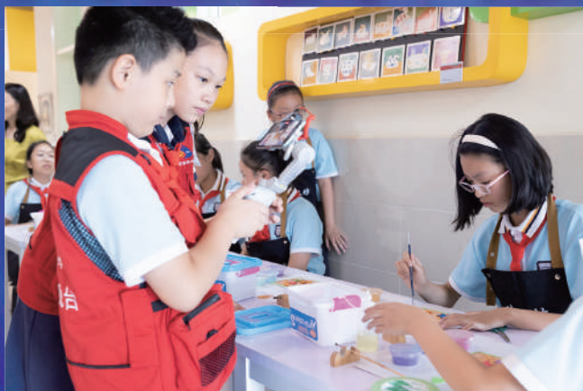
闵行区实验小学蒙正电视台小记者采访“漆艺工坊”展示活动