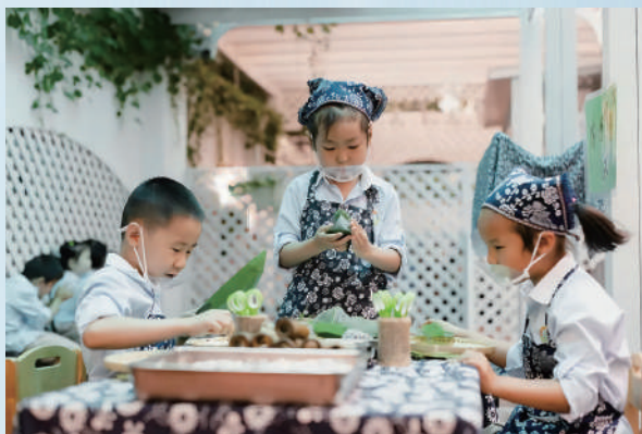
上海市闵行区龙柏第二幼儿园生活特色课程：夏日集市之包粽子