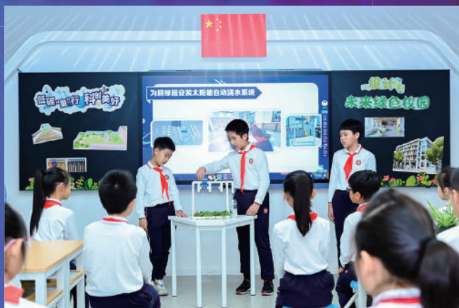
上海交通大学附属实验小学开展德育第一课堂“低碳童行 科创美好”