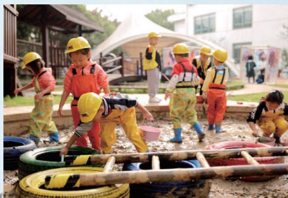
上海市闵行区七宝幼儿园户外游戏