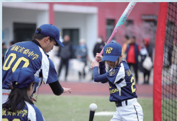
上海市闵行区浦航实验中学学生棒球击打练习