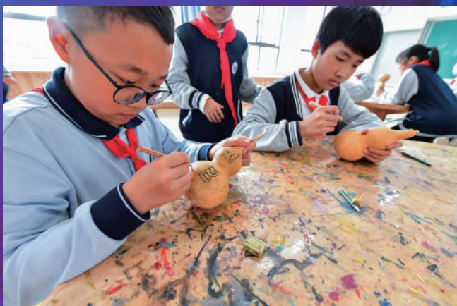
上海市闵行区教育学院附属友爱实验中学学生开展葫芦雕刻活动