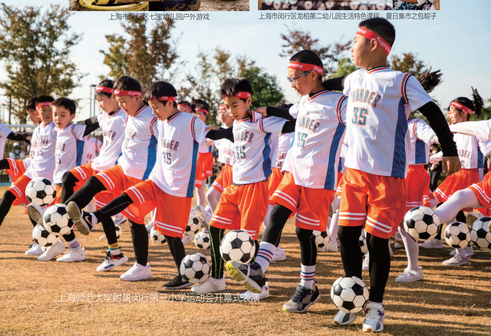
上海师范大学附属闵行第三小学运动会开幕式表演