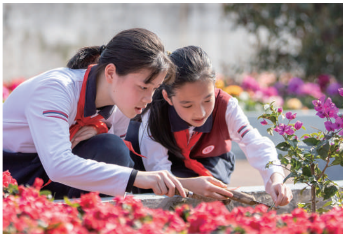
上海市大同初级中学“播种春天”劳动教育