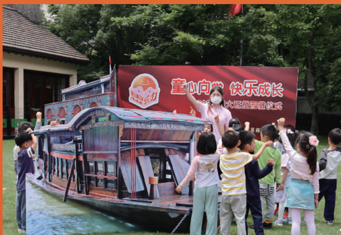
上海市黄浦区思南路幼儿园红色教育主题活动