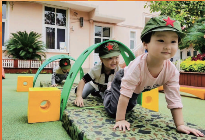
上海市黄浦区蓬莱路幼儿园“红享之旅”活动