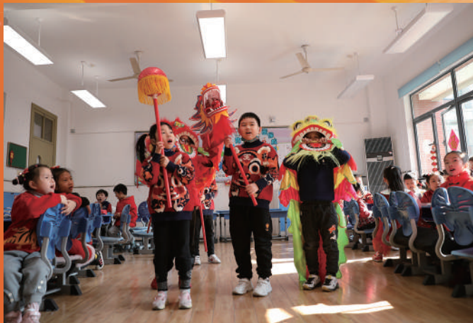
上海市黄浦区卢湾一中心小学“中国人过中国节”校园游园活动