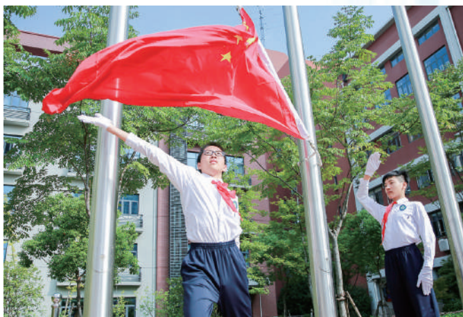
上海市黄浦区教育学院附属中山学校： 五星红旗 永远在心中飘扬