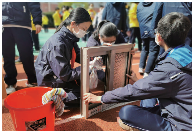
上海市格致初级中学“学雷锋 爱劳动 创美好”活动