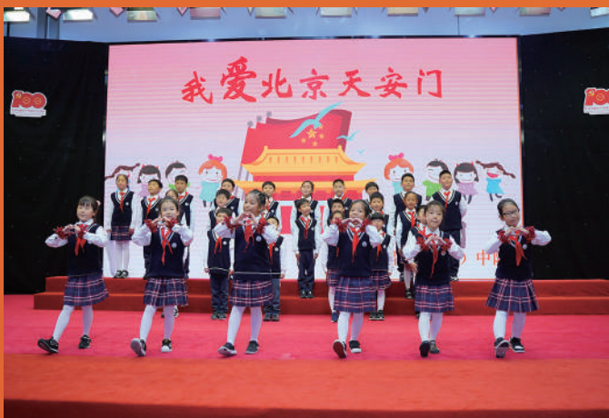
上海市实验小学“小龙人”红歌会