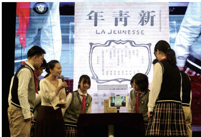
上海市卢湾中学中国系列课程之“物”说中国