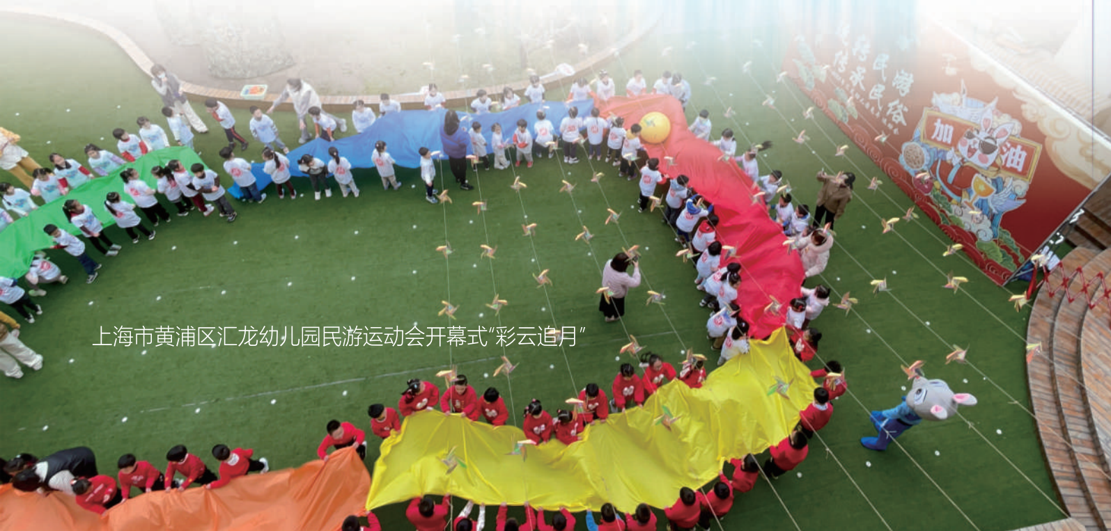
上海市黄浦区汇龙幼儿园民游运动会开幕式“彩云追月”