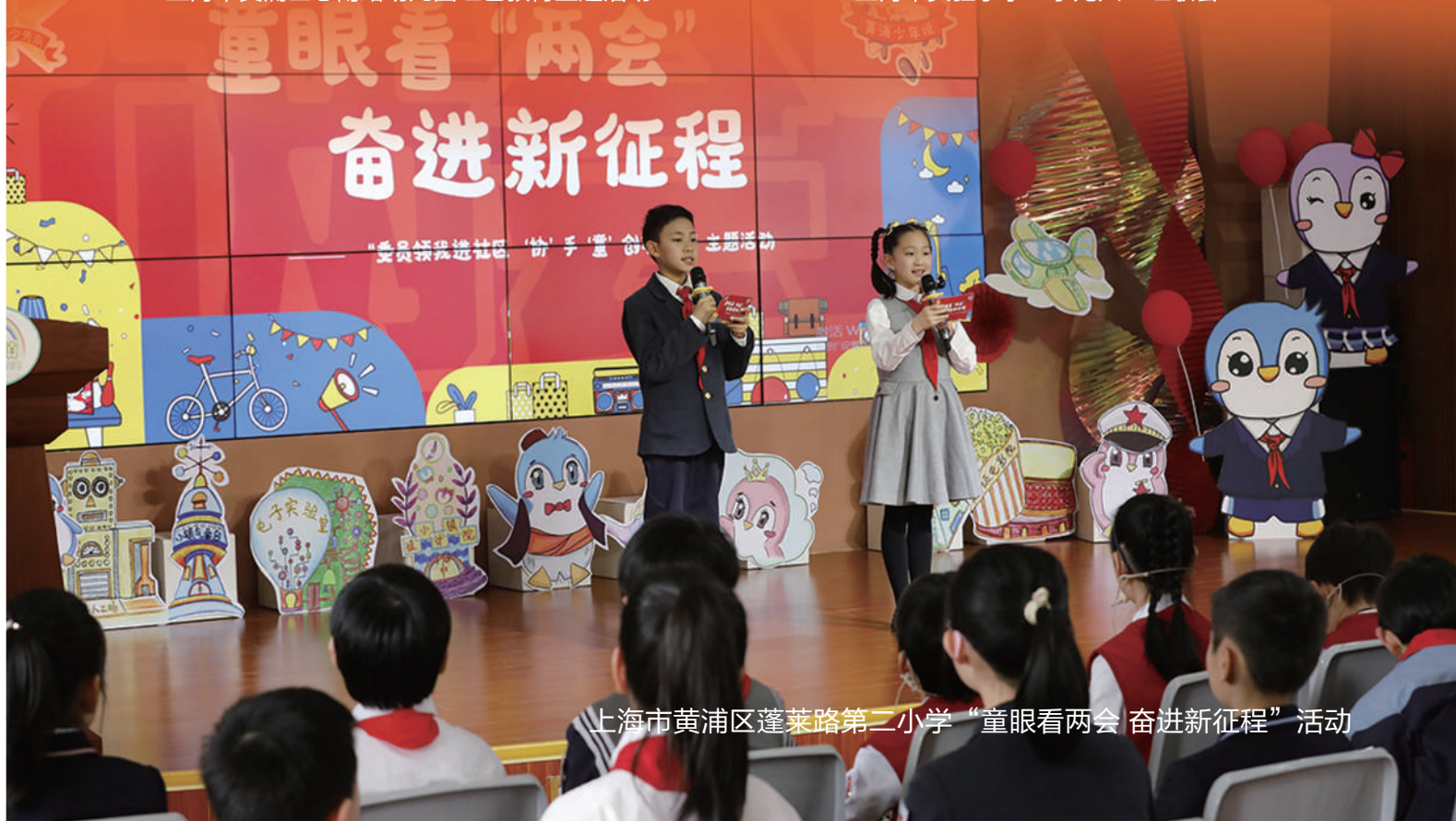
上海市黄浦区蓬莱路第二小学“童眼看两会 奋进新征程”活动